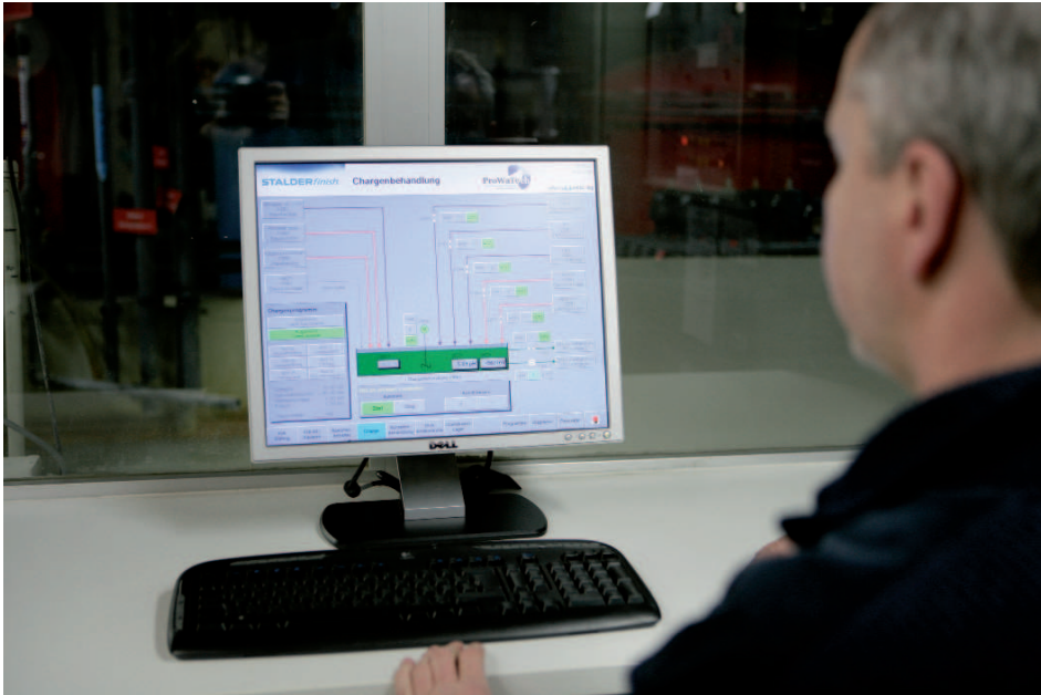
Bedienung am PC.

Um diese Herausforderung erfolgreich in Angriff nehmen zu können, musste ein besonderes Augenmerk auf folgende kritische Punkte gelegt werden: